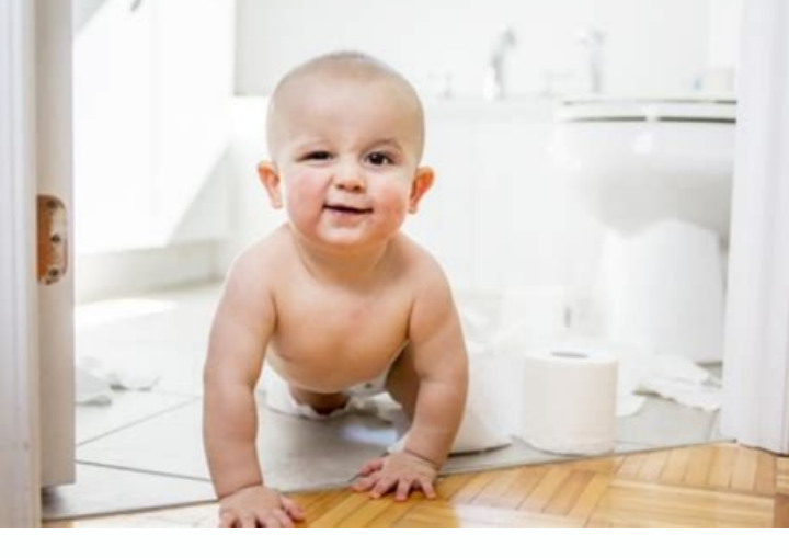
Yellow crusty skin behind baby ears. Was tun wenn baby neurodermitis hat. Mein baby hat neurodermitis was tun. What do baby red eared sliders look like.